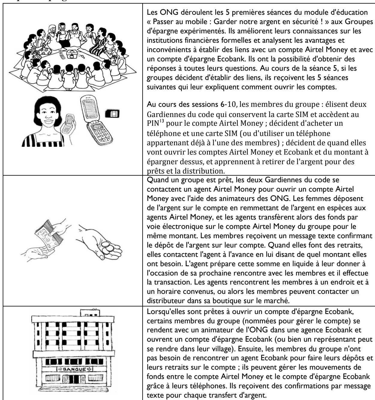
Tableau 5. Comment les groupes d'épargne établissent des liens avec Airtel Money et les comptes d'épargne Ecobank 12